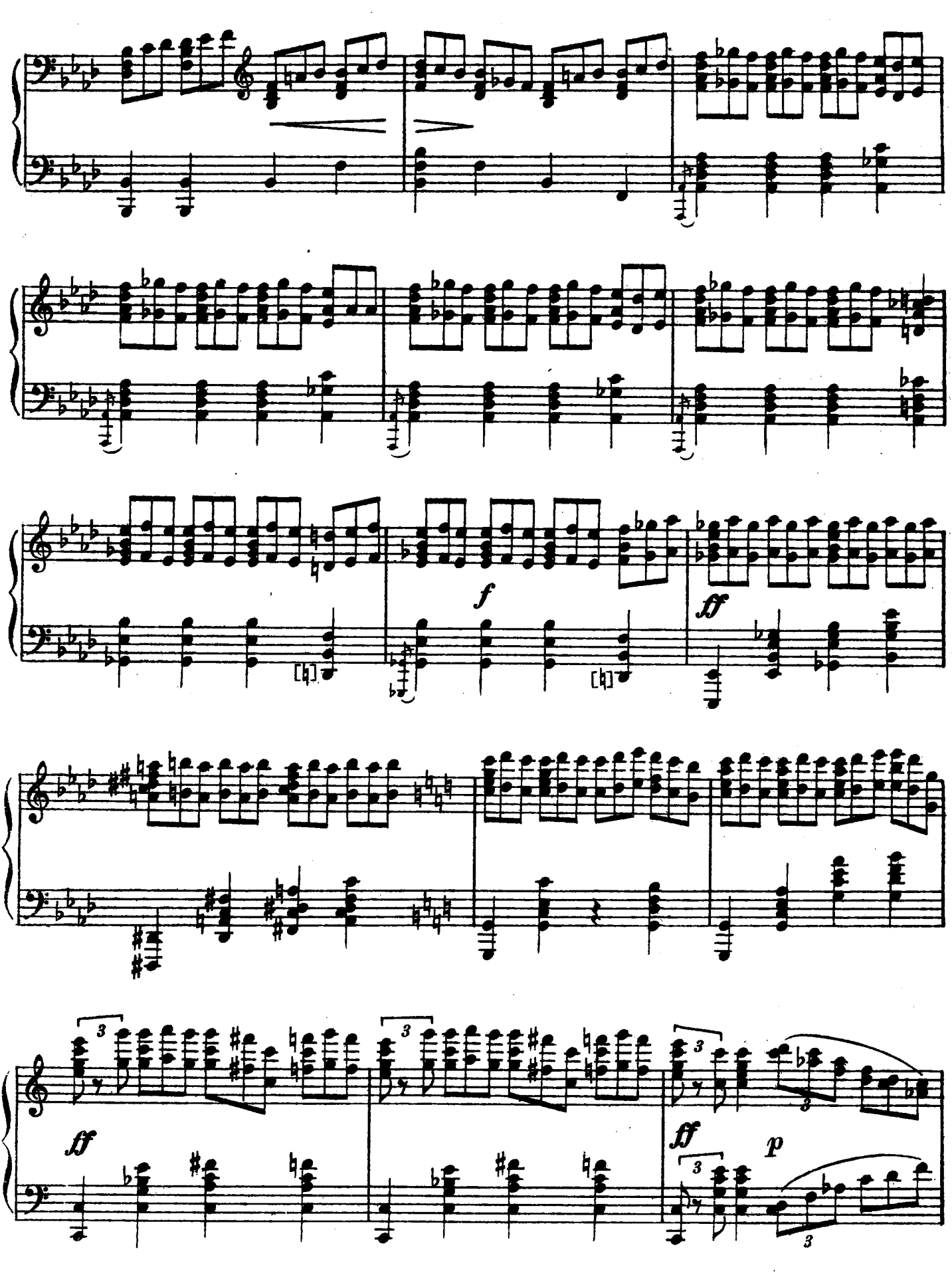
M 20114 T