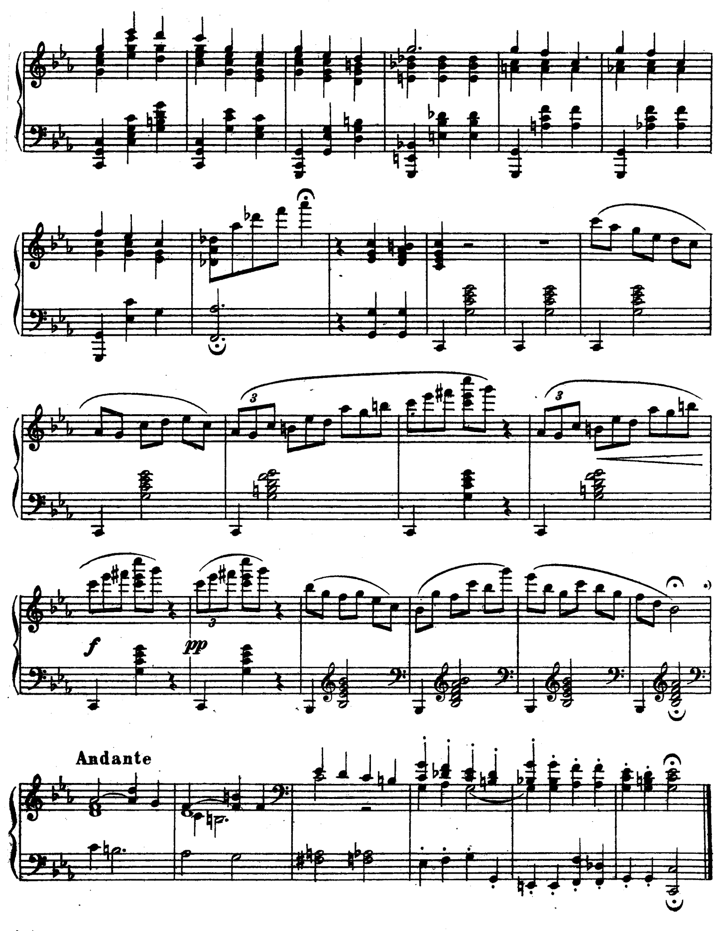
*) На этом месте автограф обрывается. Для окончания нами взяты пачальные такты номгюрна.