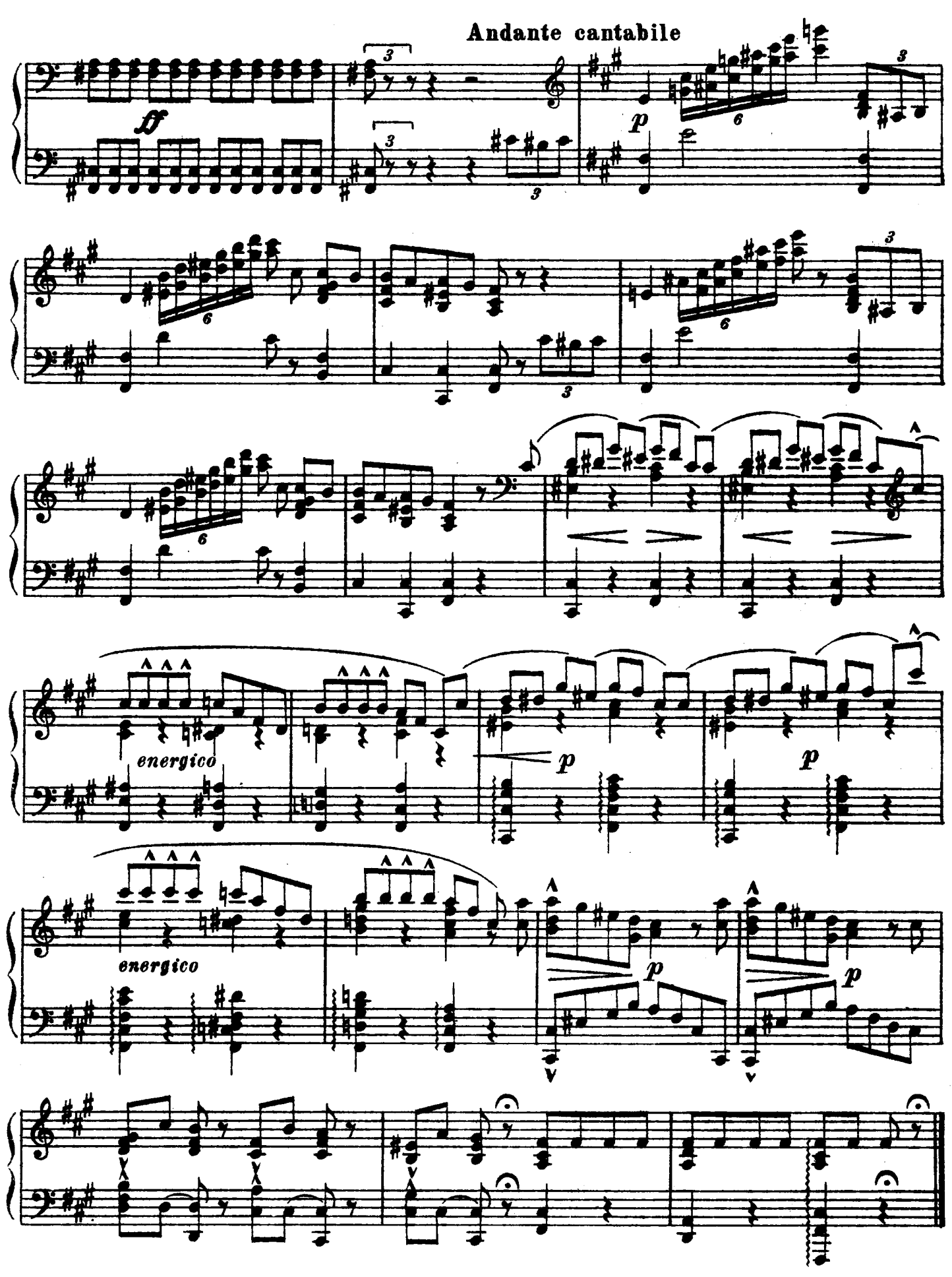
M 20114 F.