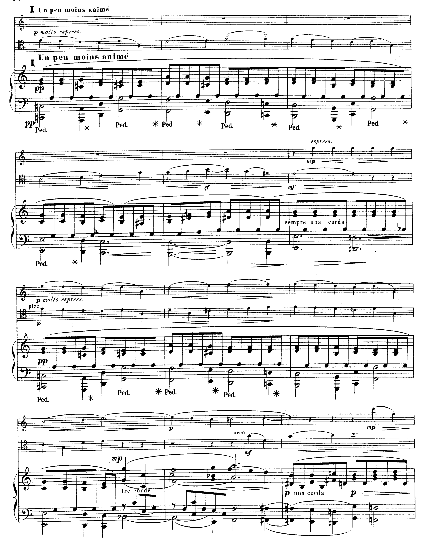
R.L.4674. & Cic.