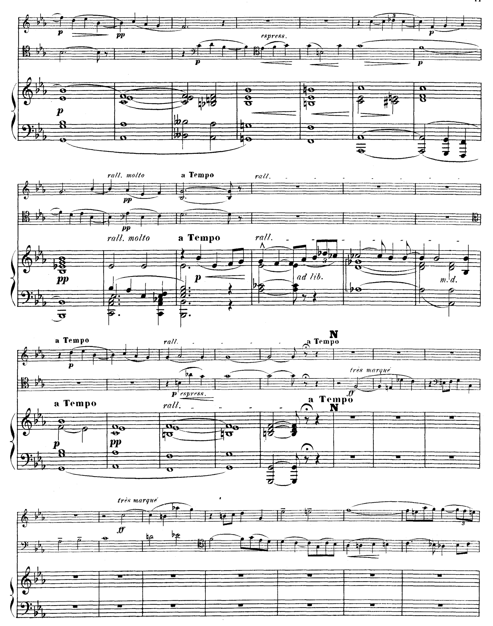
R. L. 4674 & Cie