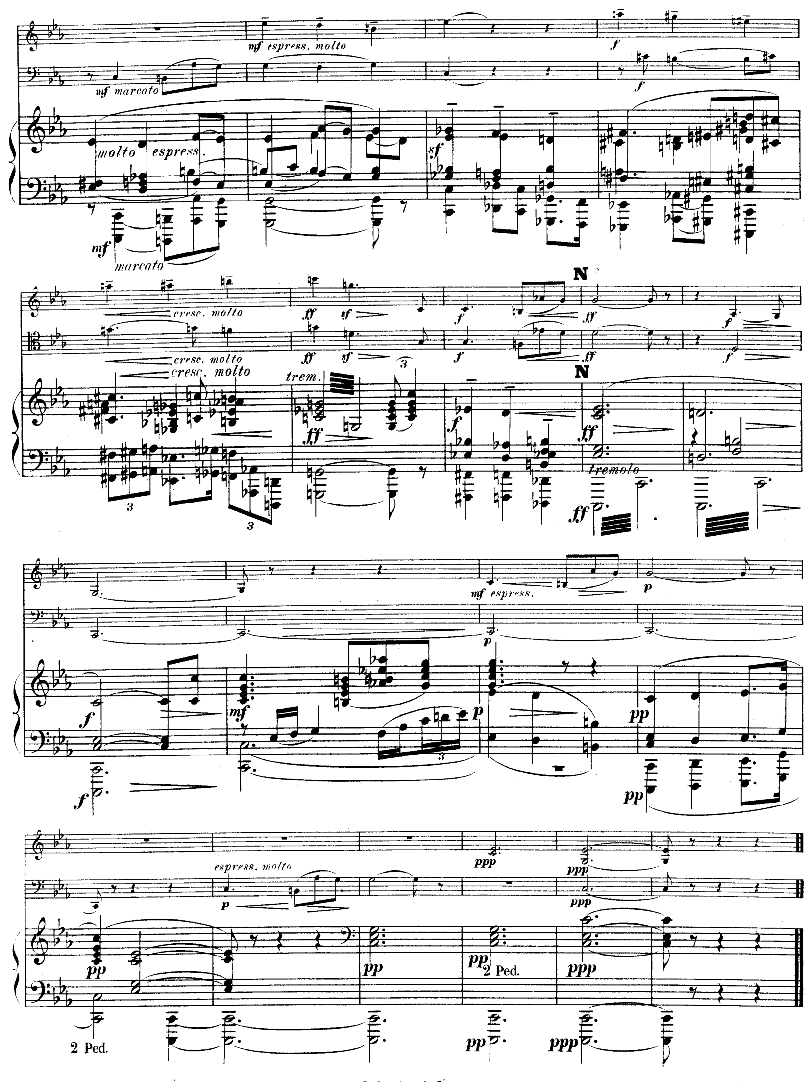
Imp. A. Mounot. Paris.