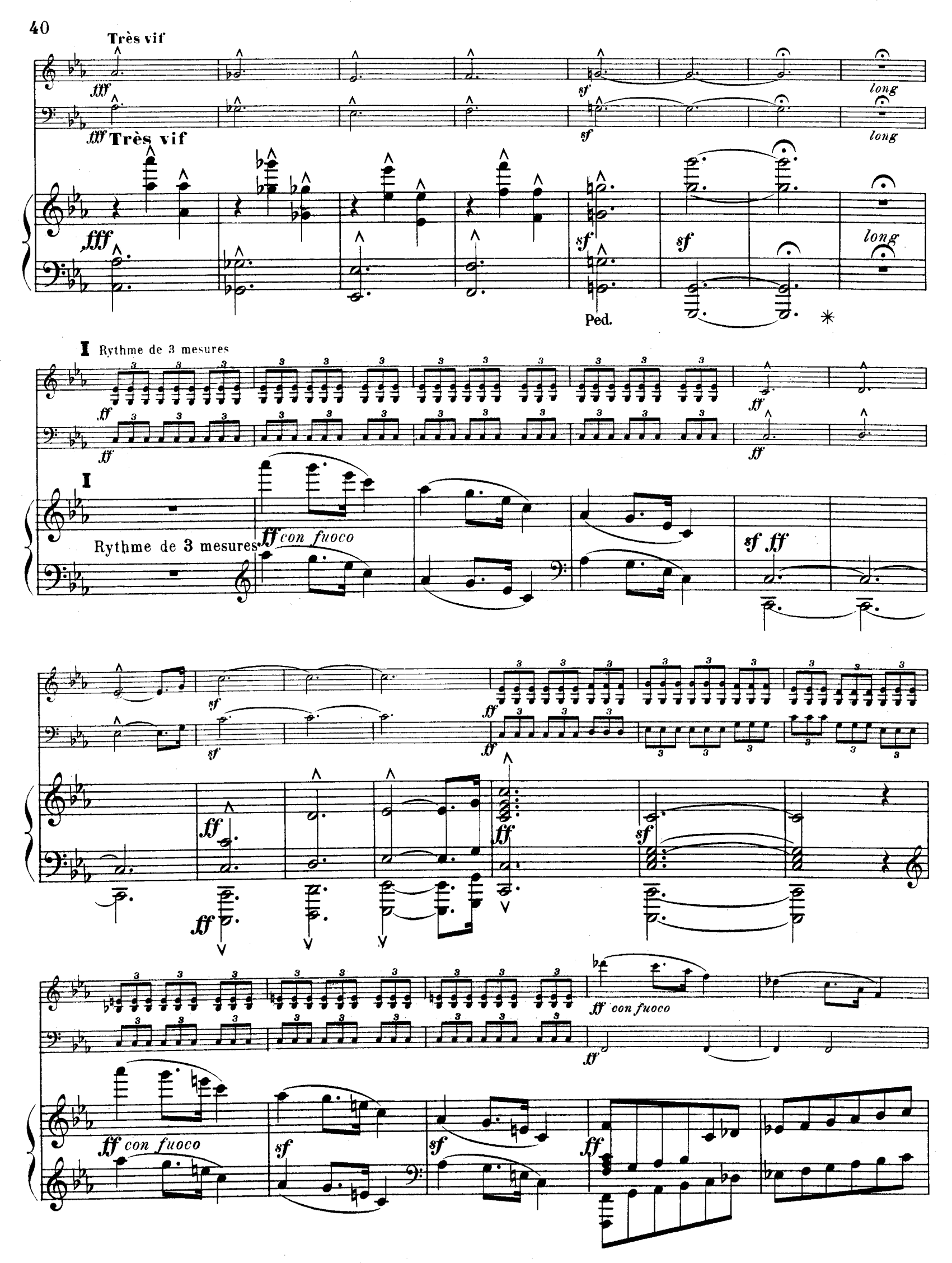
R. L. 4674 & Cie