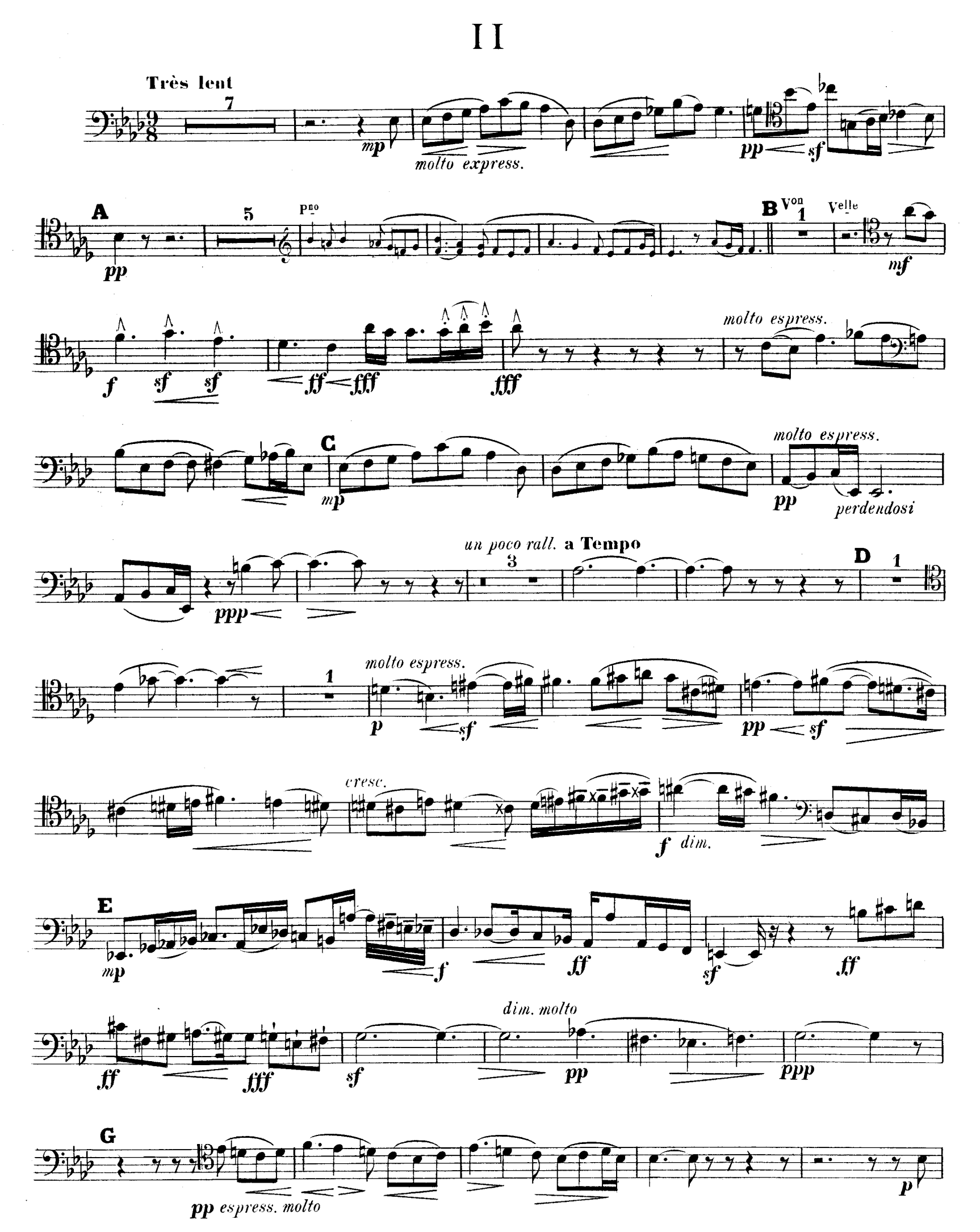
R.L.4674. & Cie