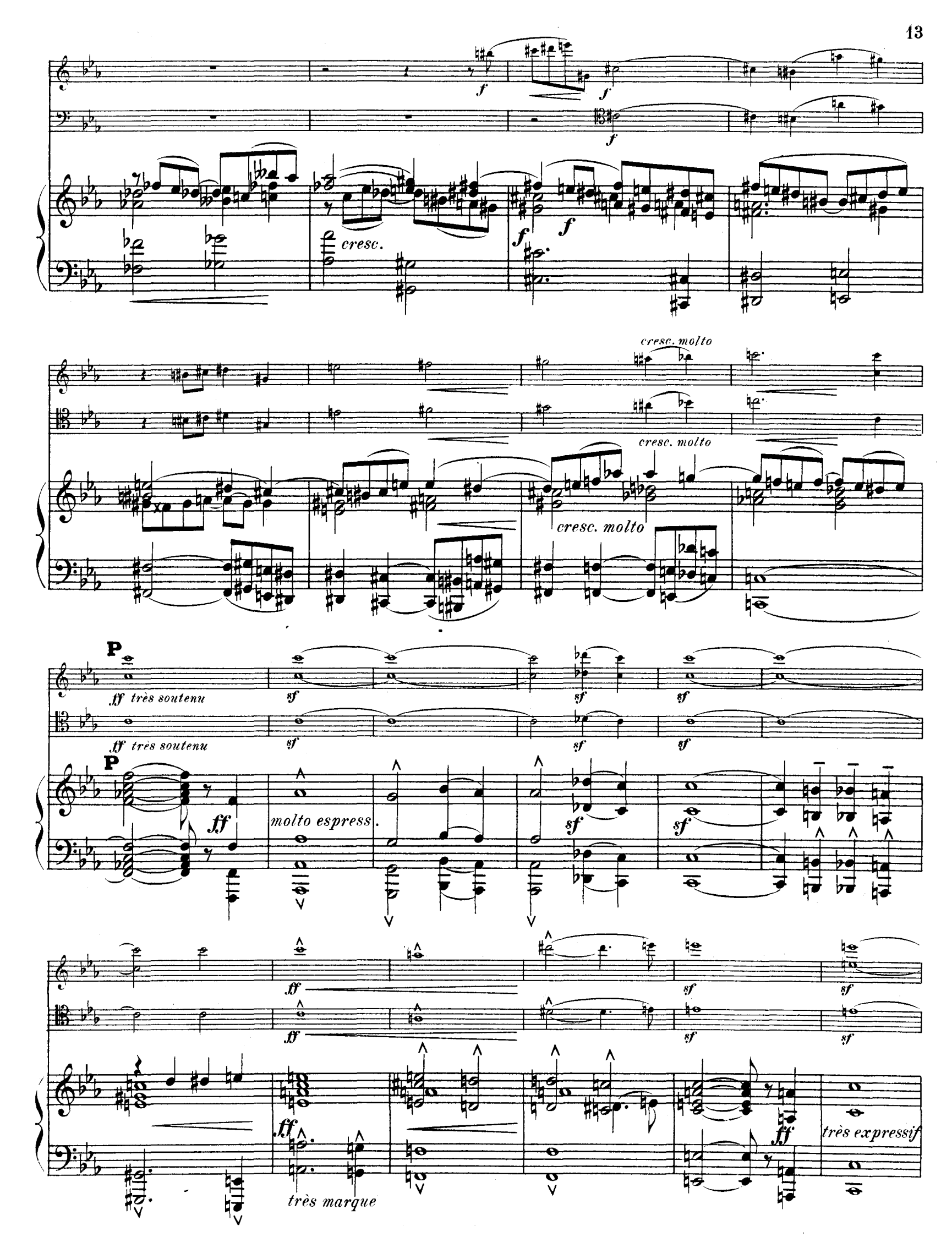
R. L. 4674 & Cie