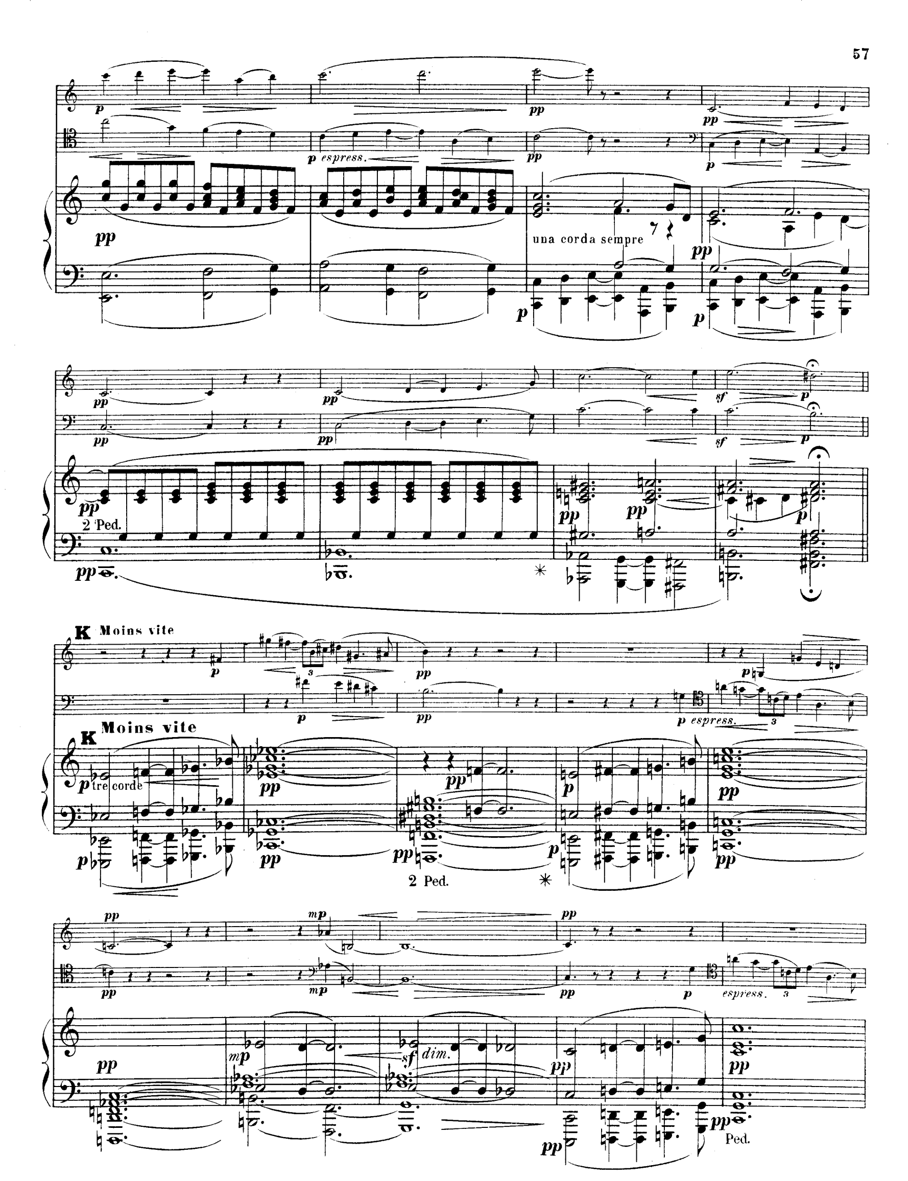
R.L.4674. & Ci: