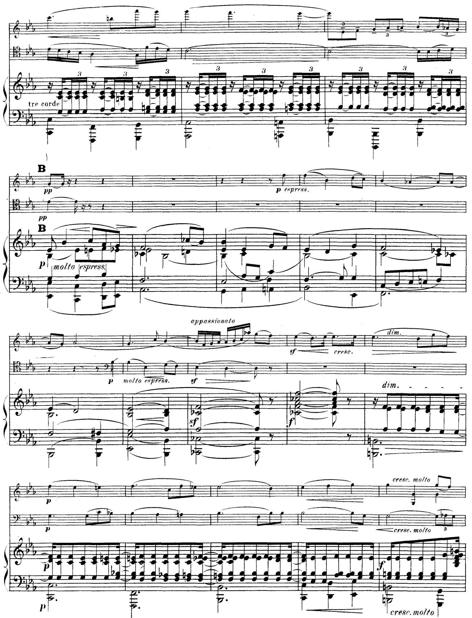
R.L. 4674 & Cie