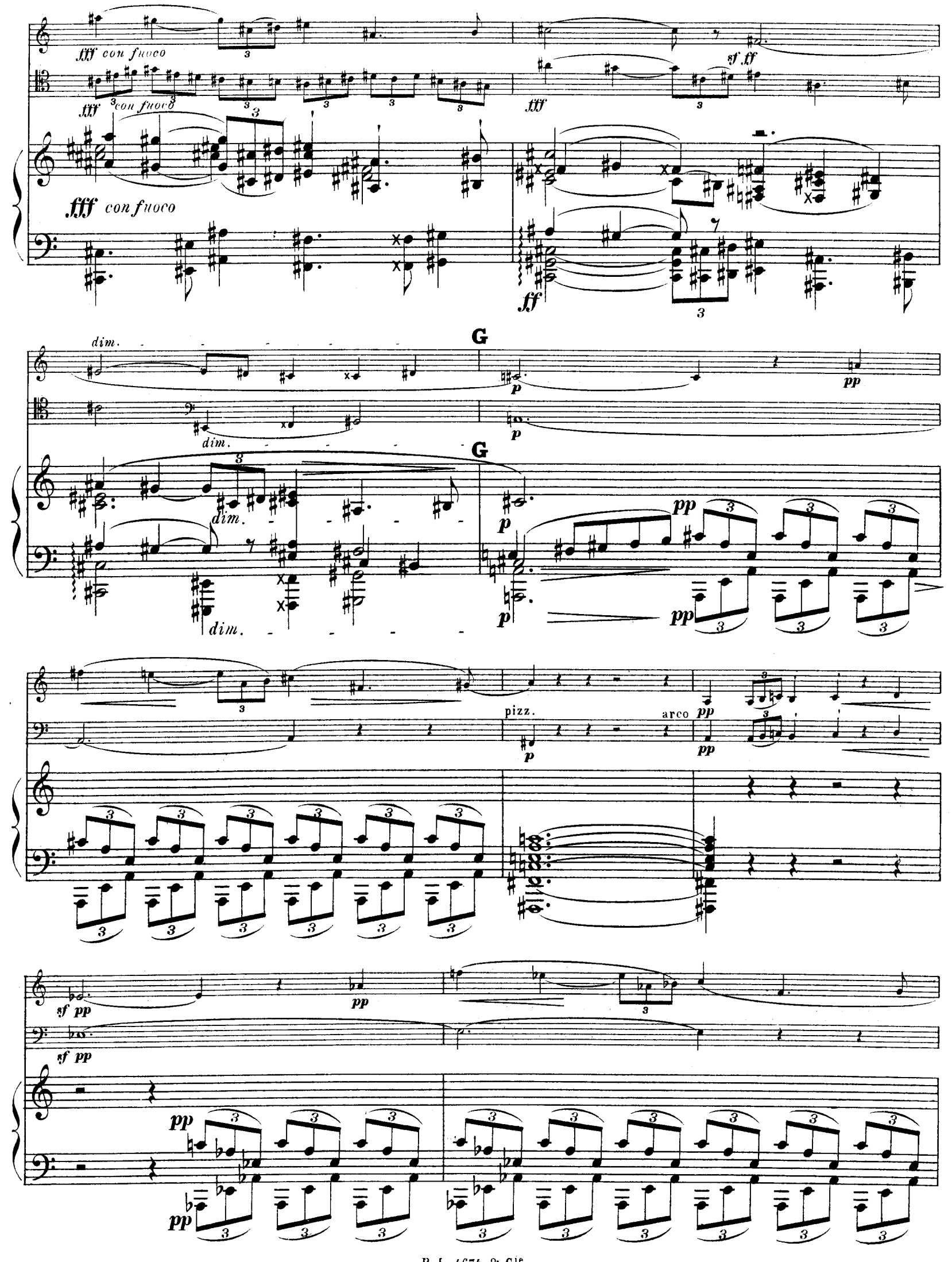
R.L.4674. & Cie