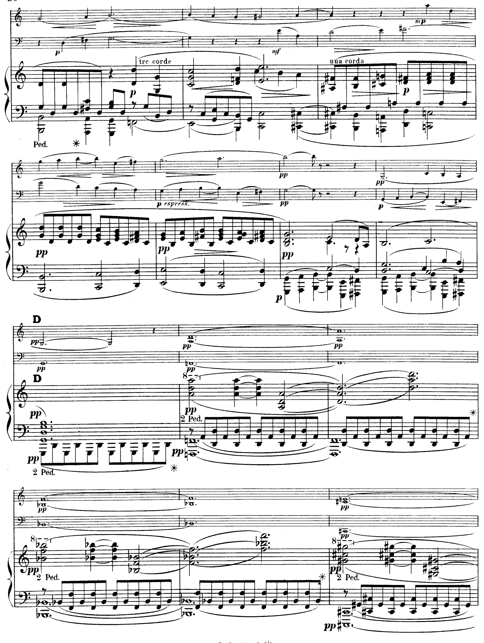
R. L. 4674 & Cie