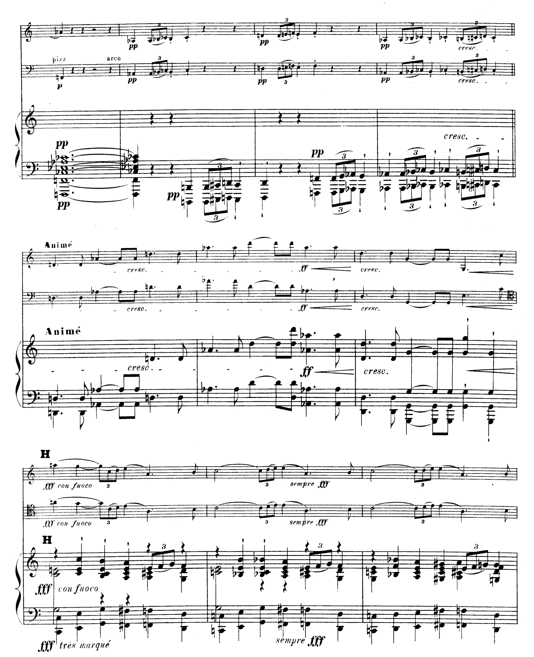
R.L.4674. & Cie.