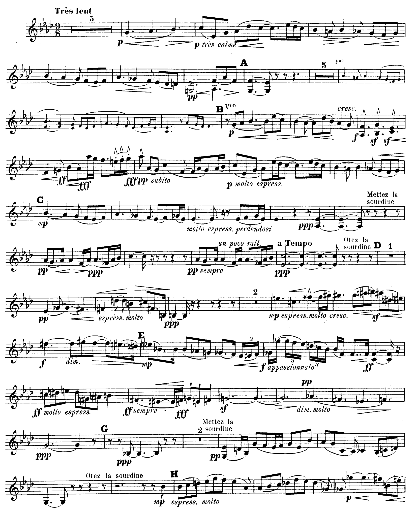
R. L. 4674. & Cit