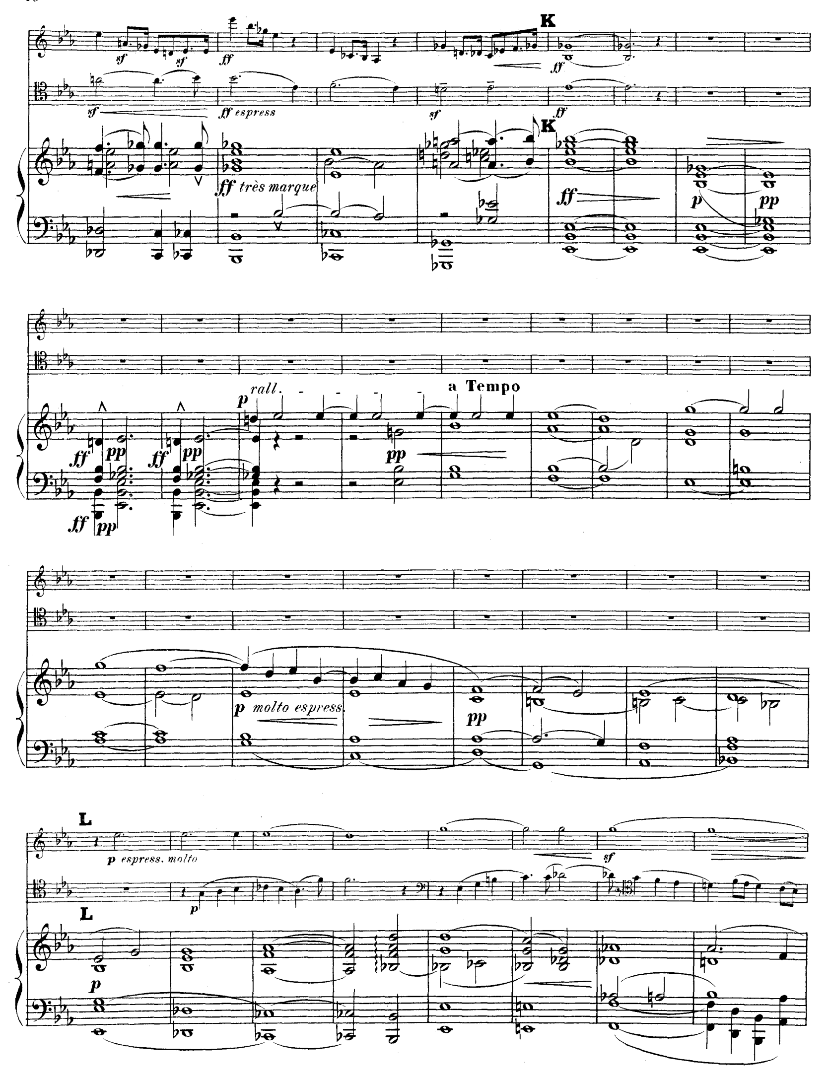
R.L.4674 & Cie