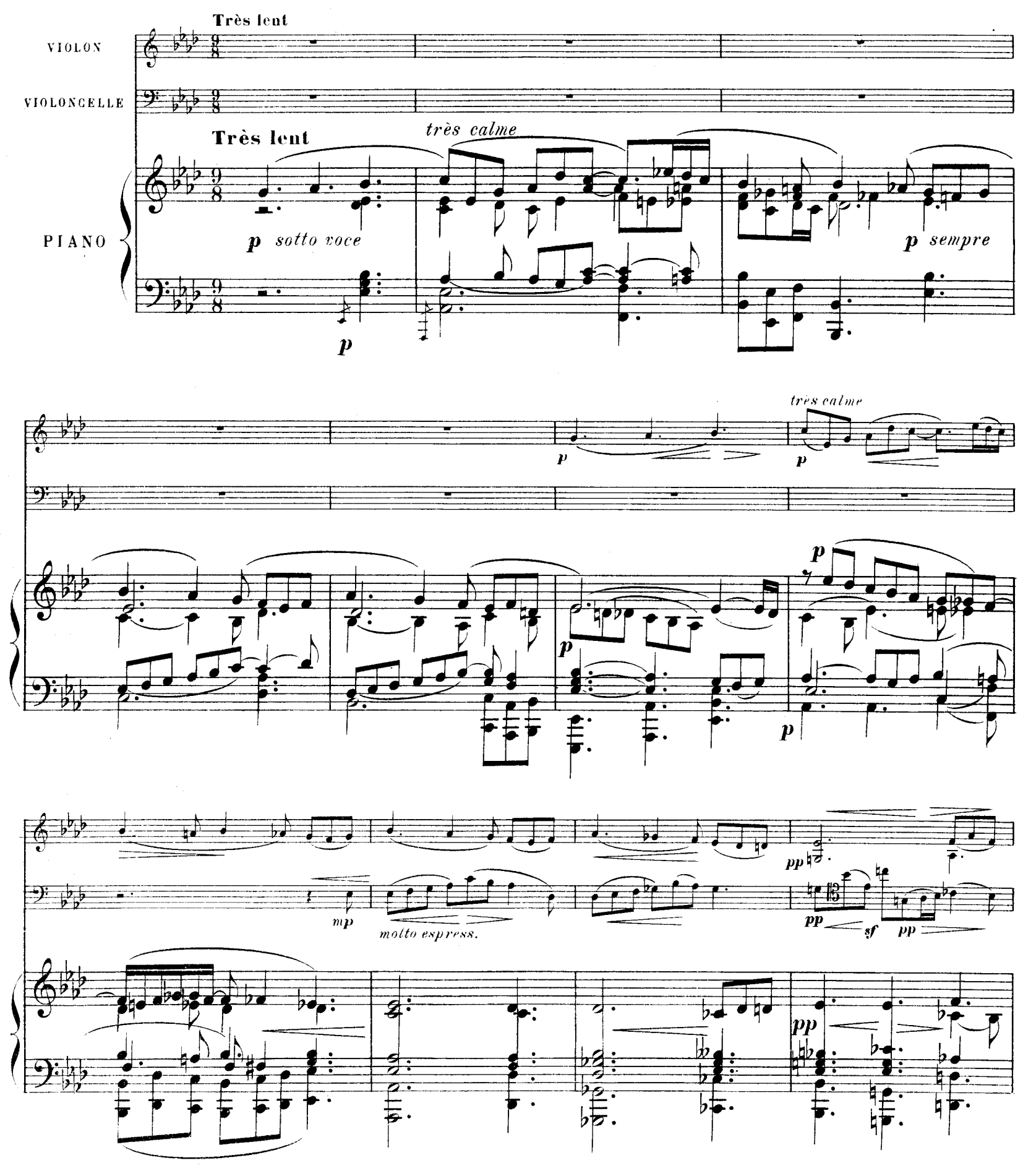
R. L. 4674 & Cie