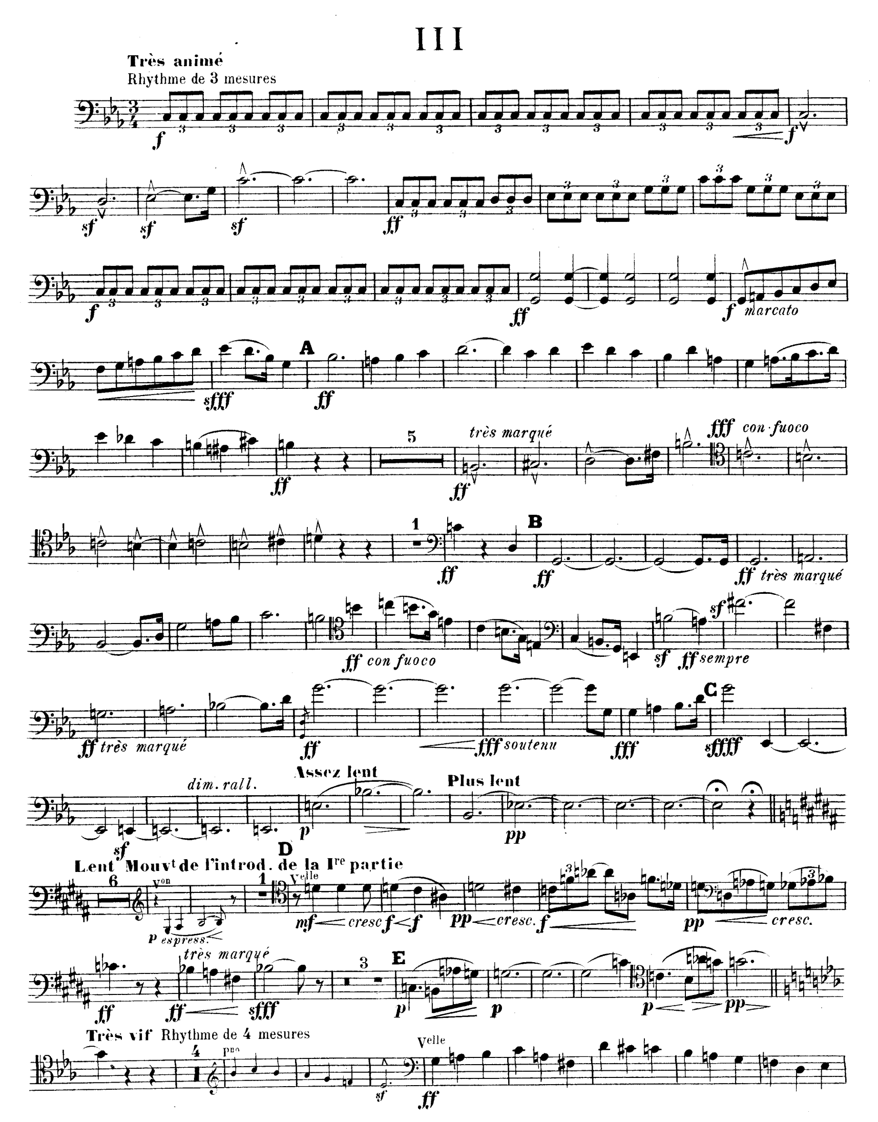
R.L.4674 & Cie.