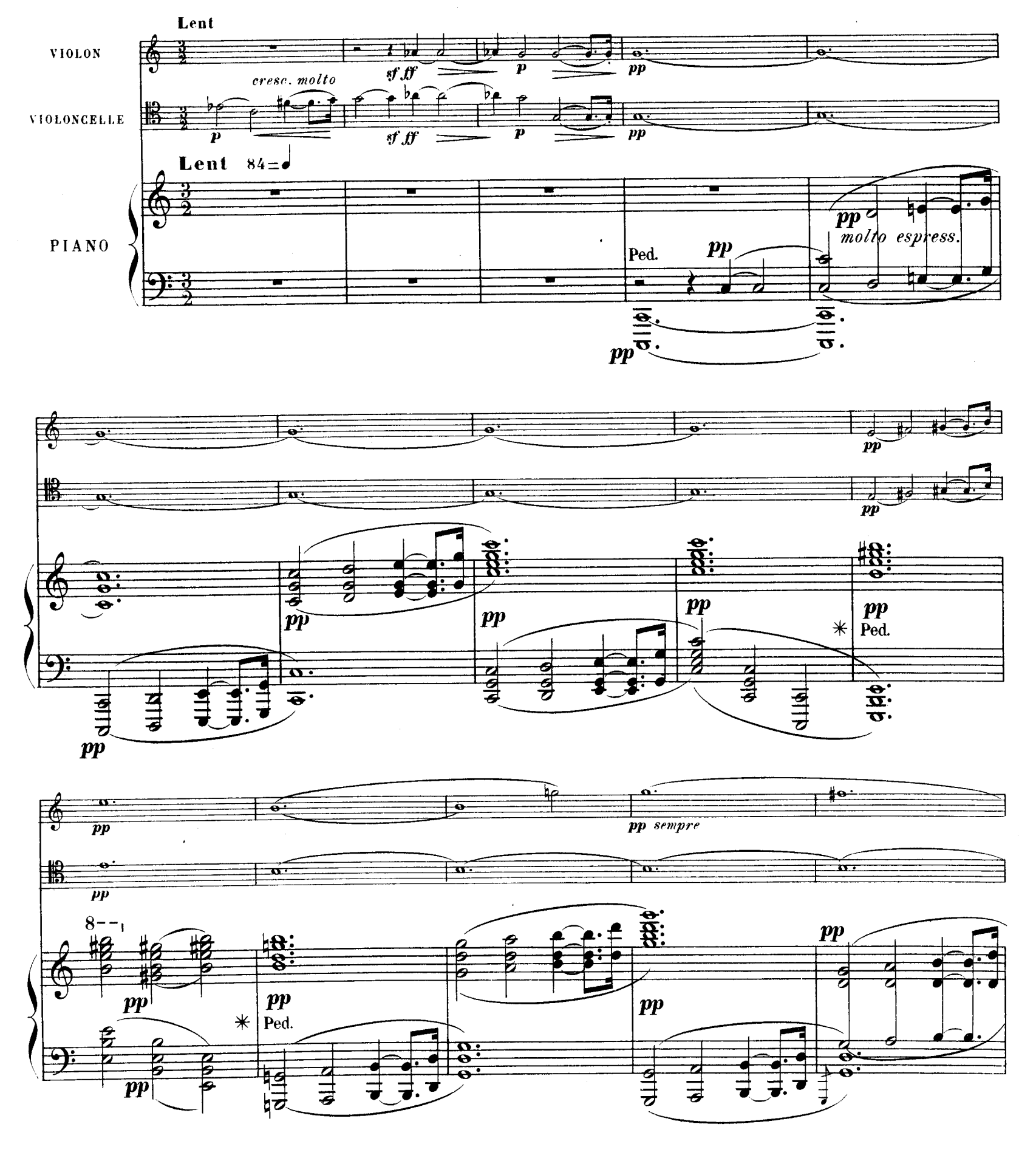
R. L. 4674 & Cie