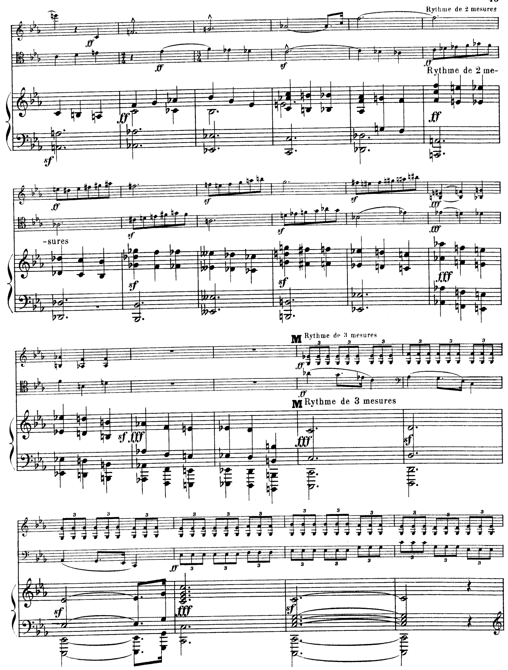
R. L. 4674 & Cie