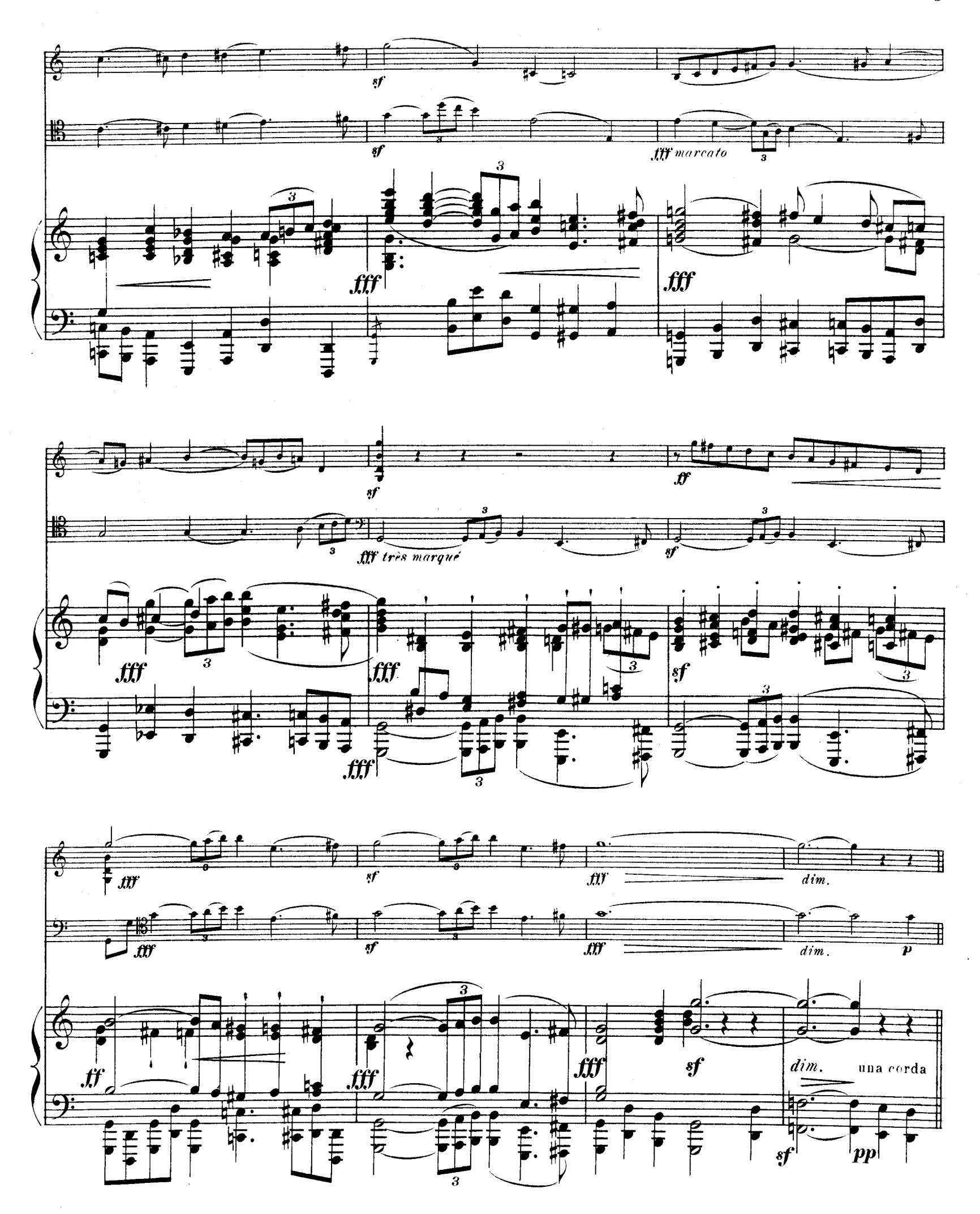
R.L.4674. & Cie.