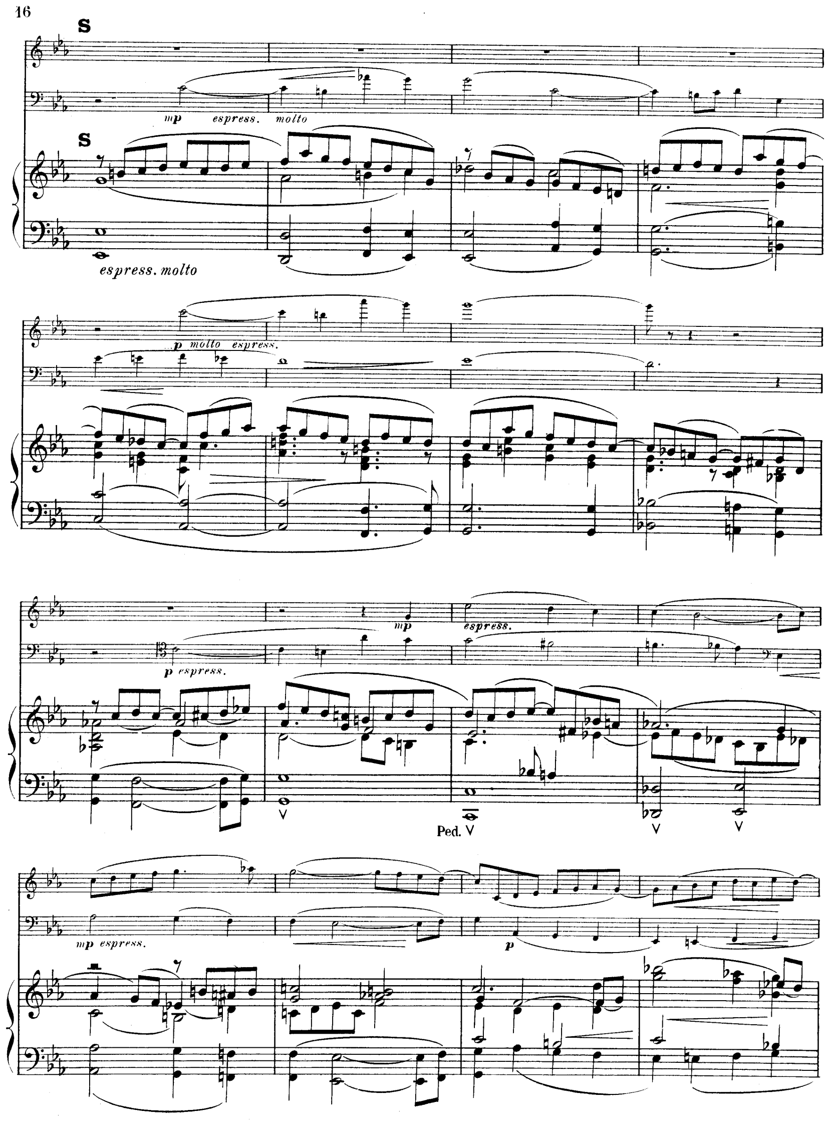
R. L. 4674 & Cie