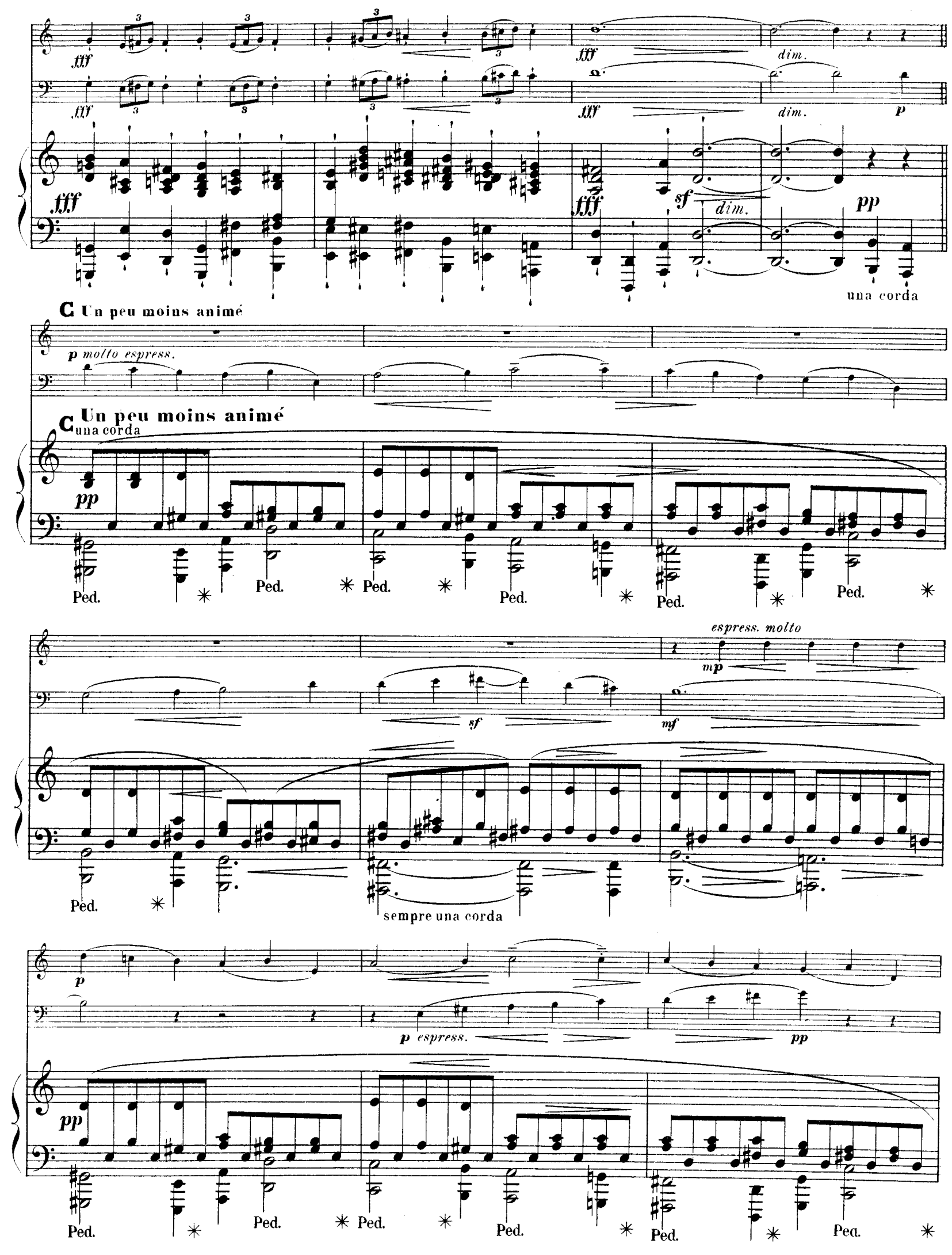
R. L. 4674 & Cie