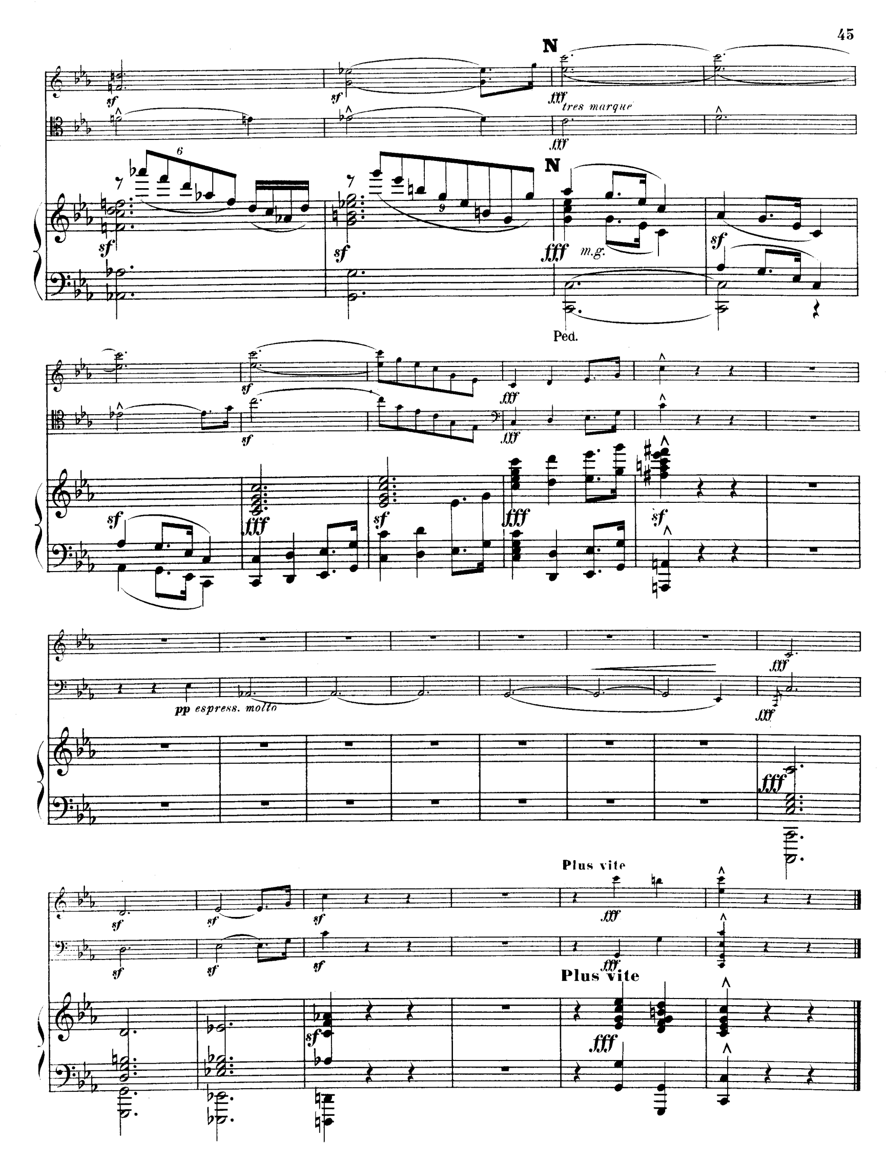
R. L. 4674 & C1º