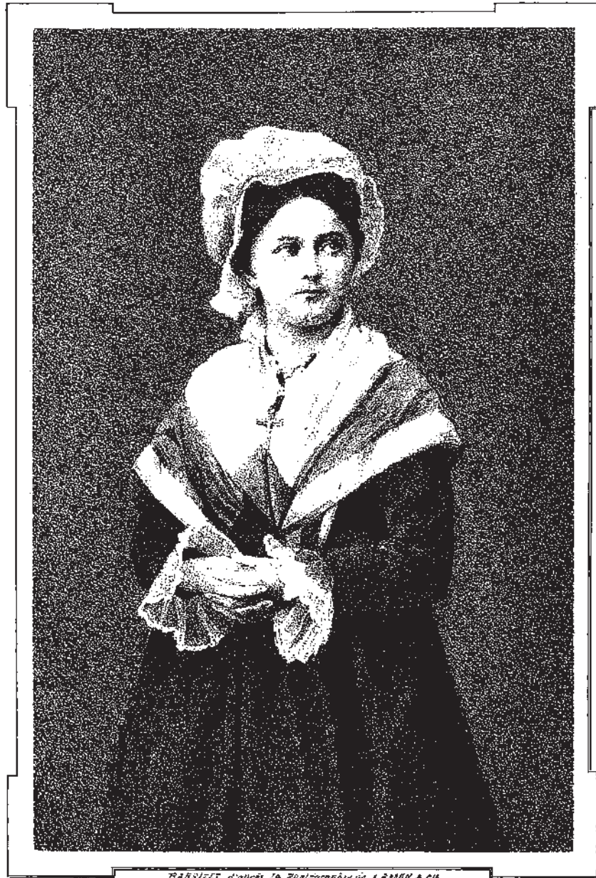
Enluminé d'après la Photographie de G. B. & Co.